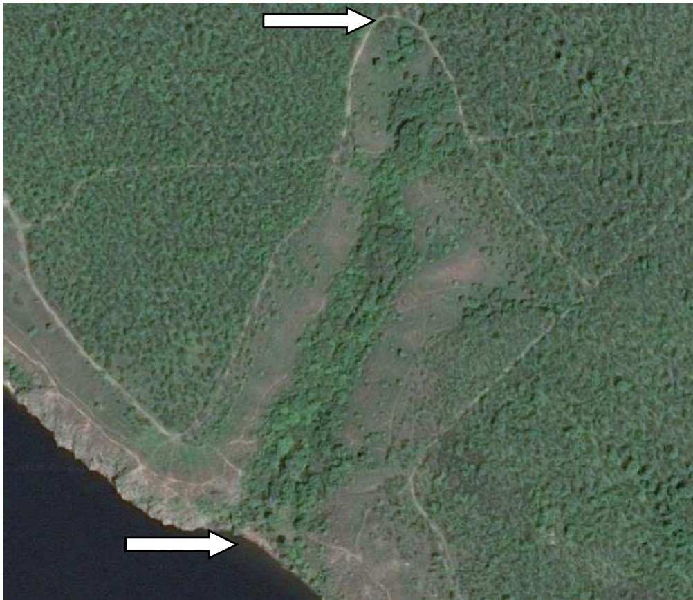
Рисунок 1 – Картосхема дослідної території ( https://www.google.com.ua/maps/ ) (координати вказаних точок 47°83'06,1" N 35°06'73,5 E; 47°82'67,9 N 35°06'57,8 E)

Естетичну складову фітоценозу визначали за [12]. Функціональну оцінку рекреаційних властивостей насадження здійснювали згідно з рекомендаціями Г. К. Солнцева зі співавт. [16]. Дослідження ступеня рекреаційної дигресії байрачного лісу проводили за [10] та з урахуванням рекомендацій В. М. Івоніна і М. С. Чириєва [9]. Нормативи рекреаційної ємності лісових насаджень та коефіцієнти кореляції визначали за ДБН 360-92**, таблиця 5.4 [6]. При визначенні форм рекреаційної діяльності користувалися рекомендаціями О. І. Тарасова [17]. Хімічні властивості ґрунту досліджували за [8]. Одержані експериментальні дані опрацьовані методами математичної статистики [13].