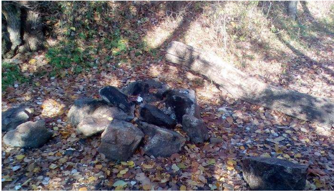
Рисунок 2 – Кострище у гирлі балки Генералка (листопад 2018 р.)

дослідження стану та властивості лісової підстилки байраку Генералка [19]. На стежках підстилка відсутня, лише зареєстрована наявність свіжого цьогорічного опаду.