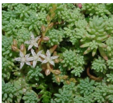
4 – S. hispanicum (О. іспанський)