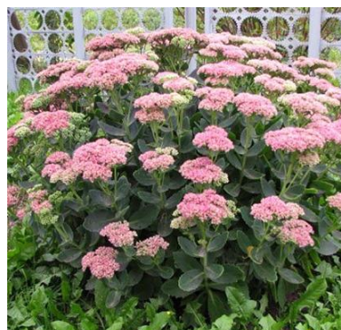
5 – S. spectabile (О. видний)