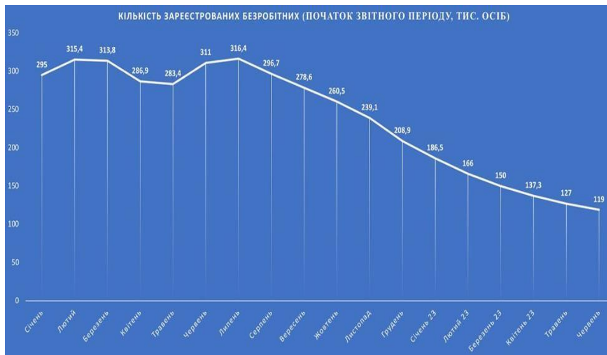
Рисунок 1 - Динаміка кількості зареєстрованих осіб на біржах праці в Україні, 2022-2023 роки. [1]

Трудовий ресурс є однією з вирішальних складових частин економіки країни. На сьогоднішньому етапі потреба галузей у кадрах та можливості реалізації інтересів спеціалістів визначаються воєнними умовами в Україні. Ринок праці в Україні після початку великої війни справді суттєво скоротився: з країни виїхали 6,2 млн українців. Частина громадян стали на захист країни і не беруть активної участі в економічній діяльності, понад 4 млн знаходяться в окупації, багато хто загинув. Все це негативно позначилося на стані вітчизняного ринку праці. Офіційна кількість українців, які зареєструвалися на біржі праці, востаннє збільшилася до липня 2022 року. (рисунок 1)