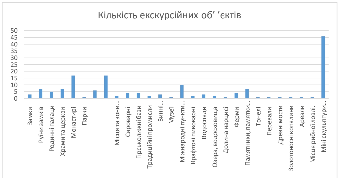
Рис 3.1 Екскурсійні об'єкти Закарпаття (розроблено автором на основі [11])

Отже, аналізуючи екскурсійні об'єкти по всьому Закарпаттю можна зробити висновок щодо превеликої їх кількості. Насамперед багато монастирів, санаторіїв та лікувально-оздоровчих комплексів; у місті Ужгород, Мукачево та селищі Міжгір'я – міні-скульптури.