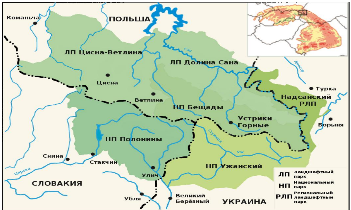
Рис. 3.3. Розташування УНПП на мапі міжнародного біосферного резервату

Розташування УНПП на мапі міжнародного біосферного резервату представлено на рис. 3.3. Цей тип парків характеризується недостатньо розвинутою туристичною інфраструктурою та невисокими показниками інтенсивності туристичного руху [29].