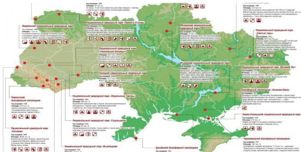
Рис. 2.3. Розташування найбільших заповідників і національних парків на карті України

Розташування найбільших заповідників і національних парків на території України представлено на рисунку 2.3.