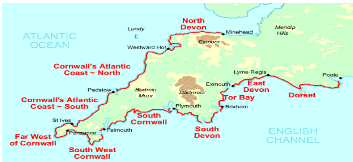
Рис. 2.1. Карта Південно-Західної національної прибережної стежки в Англії.

Фінансове становище національних парків Європи можна описати як стабільний. Дохід від рекреаційних можливостей не поступається американським. Хоча європейські парки відчувають сильні погодні варіації і не відрізняються стабільними температурами як в США, потік туристів теж можна відчувати цілий рік. Цим обумовлюється наявність великої кількості гірських масивів в національних парках Європи, де здійснюється гірськолижний туризм. Спеціально обладнані території для заняття цим видом активного відпочинку не несе загрози навколишньому середовищу [45].