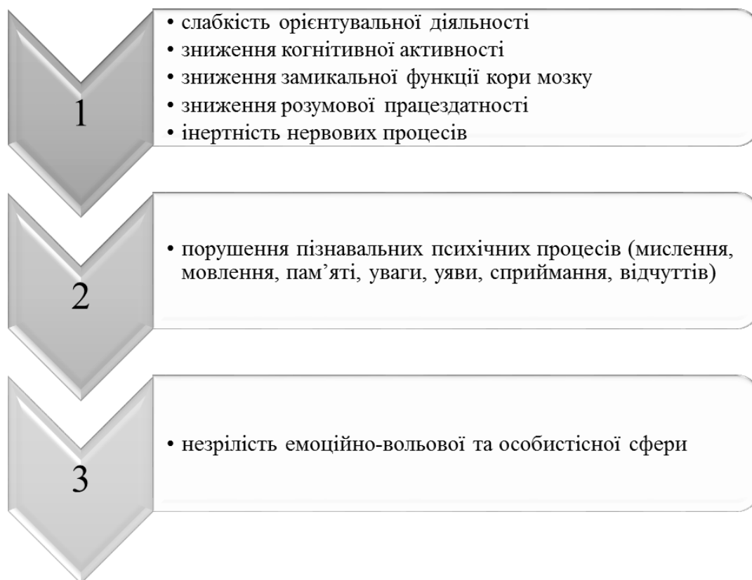
Рис. 1. Структура порушення при зниженні інтелектуальної функції [3, с. 47].

Загалом можна зазначити, що первинні порушення є наслідком ядерного (органічного) пошкодження аналізаторів, центральної нервової системи. Вторинні та третинні ускладнення постають з первинних і є наслідком аномального розвитку. Педагогічні зусилля спрямовуються саме на вторинні та третинні порушення розвитку осіб зі зниженням інтелектуальної функції, оскільки саме вони піддаються корекційному впливу.