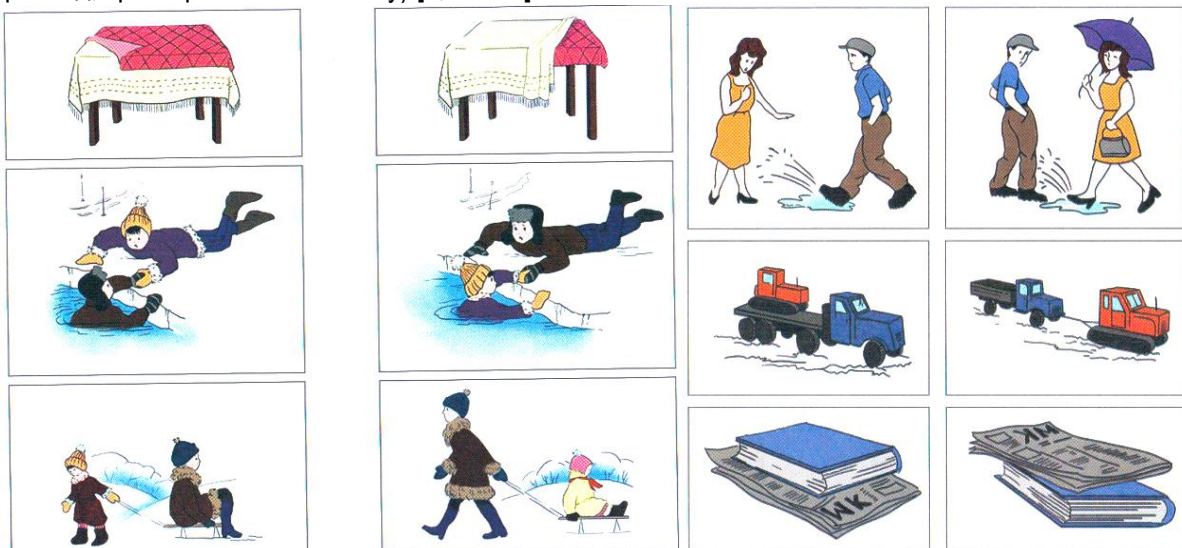
Рис. 3. Стимульний матеріал для діагностики логіко-граматичних конструкцій [3, с. 45–47]

Завдання: на основі мовленнєвої інструкції дитина повинна знайти малюнок, який їй відповідає (наприклад, трактор везе вантажівку) [2, с. 192].